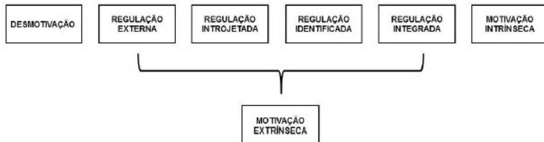
Figura 1 – O continuum da regulação do comportamento, como taxonomia da motivação humana.

Fonte: Adaptado de Ryan e Deci (2000a) e Reeve, Deci e Ryan (2004).