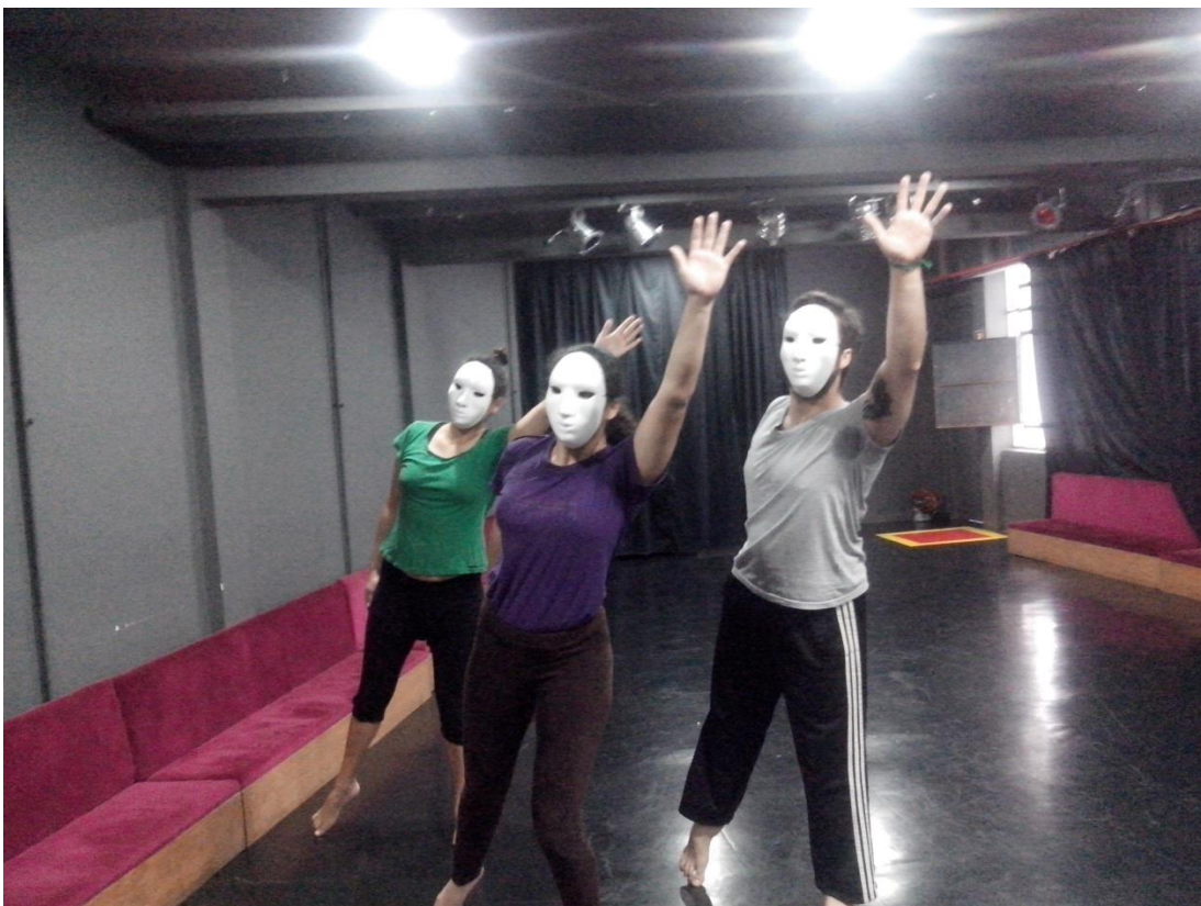
Figura 10. Improvisação com máscara neutra : O adeus em coro.