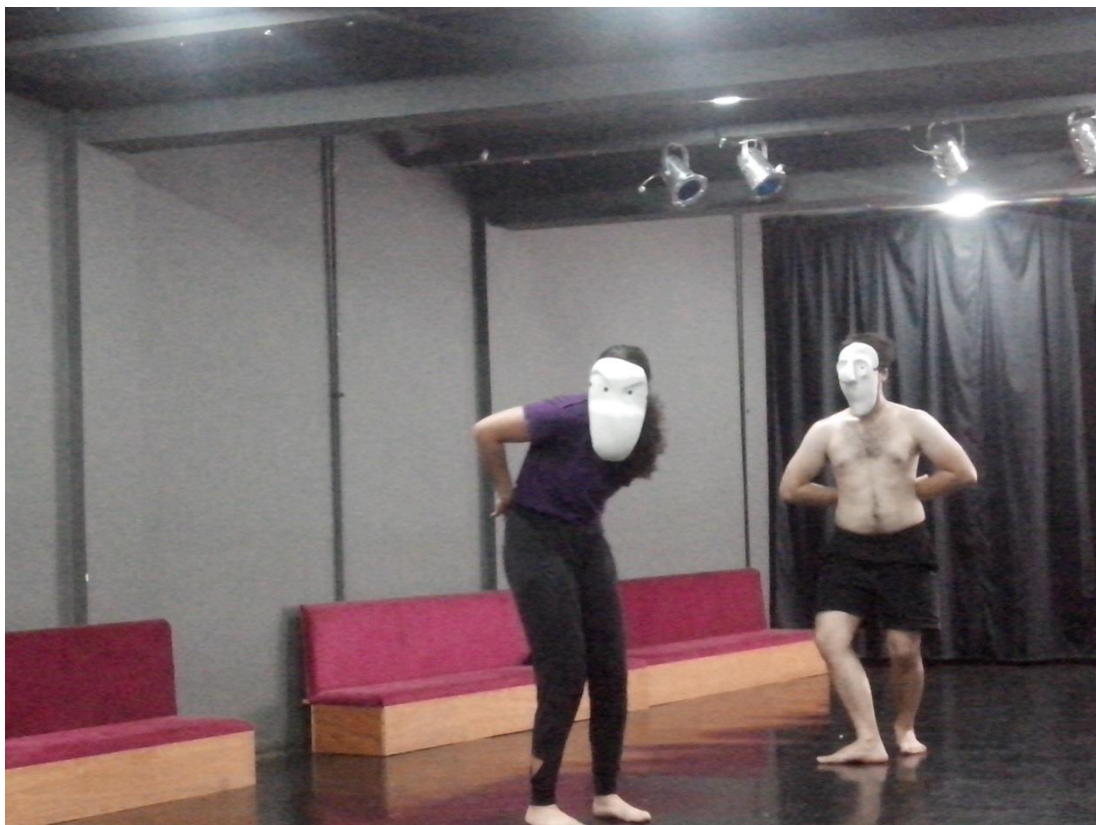
Figura 12. Improvisação com máscara expressiva.