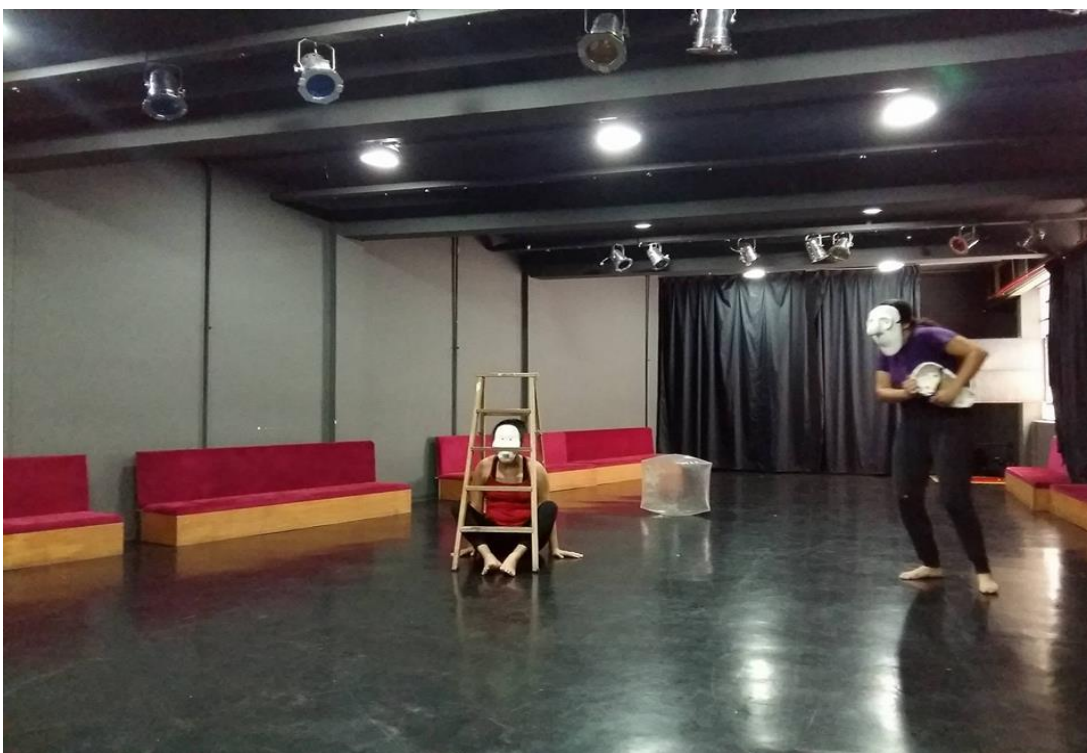
Figura 11. Improvisação com máscara expressiva.