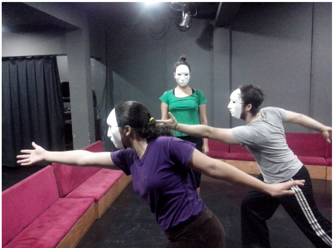
Figura 2. Atores em demonstração prática do exercício “lançar a pedra”.

No último exercício da fase dedicada ao despertar, os atores trabalharam com dois temas muito simples da vida comum, provavelmente já experimentado por todos os atores: dar um adeus e lançar uma pedra. Segundo Lecoq (2010) trabalhar com temas da vida comum consiste num meio eficaz para observar o ator, sentir o desenvolvimento de sua presença cênica e de sua sinceridade. Neste exercício, os atores iniciam individualmente, para então, fazer a ação em coro. Quando trabalham em coro os atores se unem, e realizam a mesma ação como se fosse um só corpo em cena, criam laços e agem todos no mesmo ritmo e intensão. O objetivo é possibilitar que o ator encontre o essencial da ação.