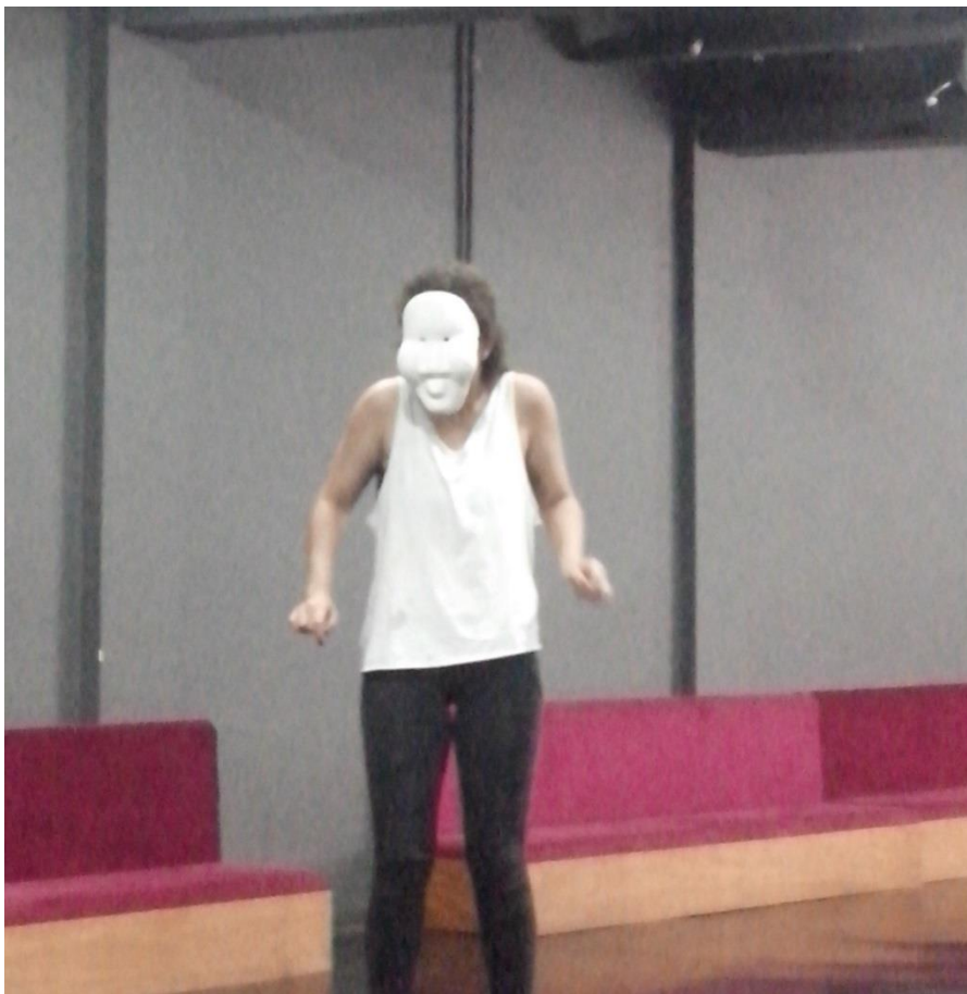
Figura 9. Improvisação com máscara expressiva.

Com as máscaras expressivas, trabalhamos alguns personagens que testamos a partir do que o formato da máscara nos sugeria. As máscaras expressivas imprimiam uma imagem que levava a determinado ritmo e ação independente dos estímulos. Notamos que a máscara expressiva tem uma vida, que ator precisa estar disponível para ouvir. Um dos motivos de a máscara neutra anteceder às expressivas no processo de formação é o fato de que, por não impor nenhuma imagem, o ator precisa buscar em si mesmo as referências de trabalho, depois que conhecer e dominar suas potencialidades, então estará pronto para ouvir às exigências que uma máscara expressiva imprime.