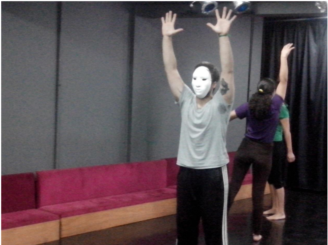
Figura 3: Atores em demonstração prática do exercício “o adeus”.

Apesar de aparentemente simples, os atores encontram problemas em estabelecer uma ligação entre a vida comum e a inventada. Peter Brook (1999) ajuda-nos a pensar nesta problemática, o encenador afirma: