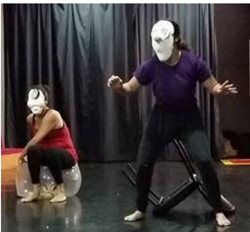
Figura 14. Improvisação com máscara expressiva.