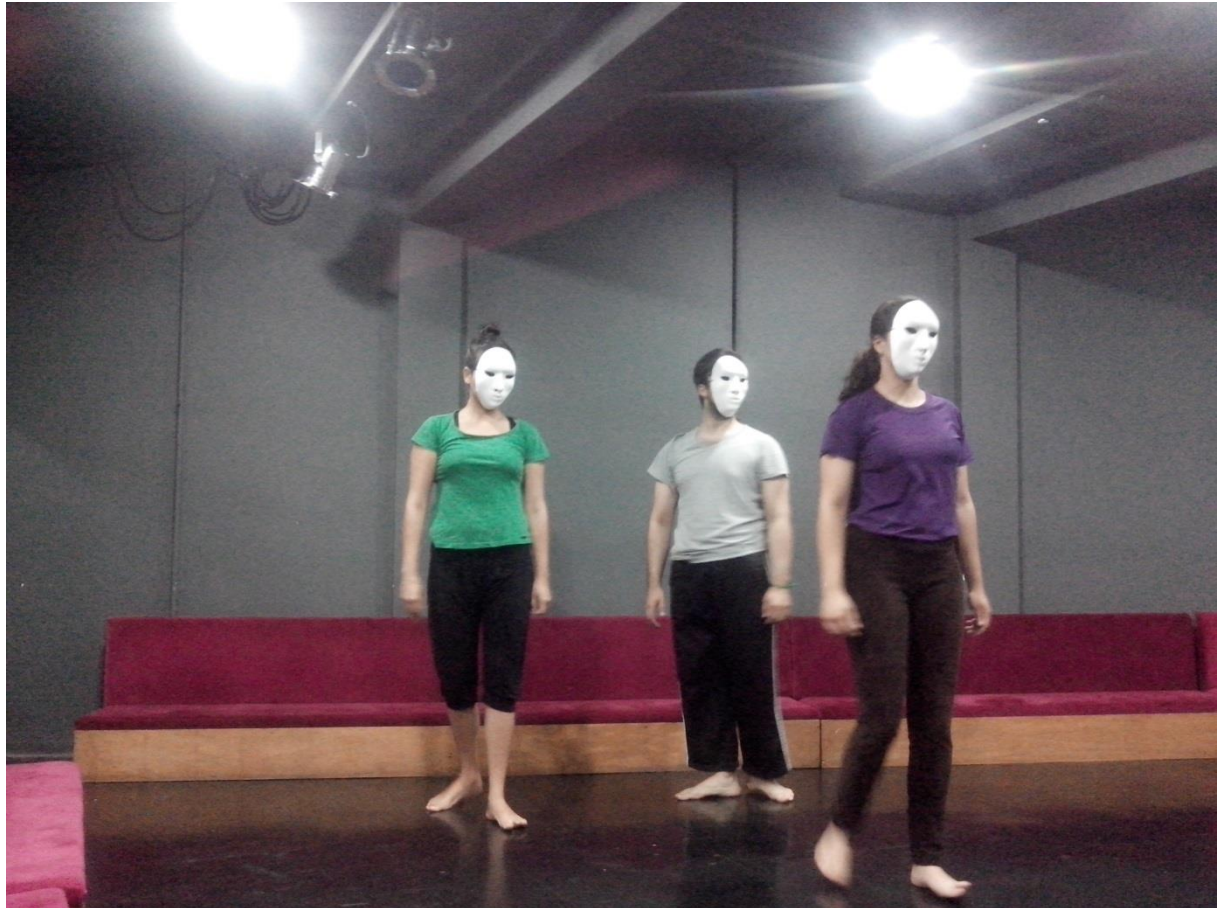
Figura1. Atores em demonstração prática do exercício “caminhada com fio condutor”.

o ritmo. No começo, todos os atores estavam lentos, principalmente com a máscara neutra. Tempos depois, os atores se acostumavam a determinado ritmo, e estagnavam a ação. Todos os atores pareciam robotizados com a máscara neutra e a energia desaparecia.