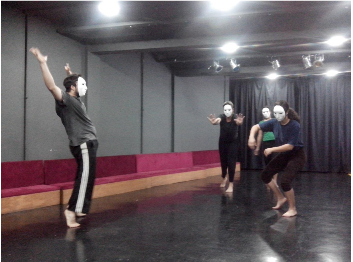
Figura 4. Demonstração prática da improvisação com elemento “ar”.

tiveram que caminhar pela sala sentindo a resistência do ar, buscando uma qualidade corporal que é relaxada, mas alerta. Por alguns instantes, os atores encontraram essa qualidade, mas depois de certo tempo, a força expressiva que conquistaram no início do exercício se esgotou, os atores passaram a fingir a resistência do ar em oposição ao corpo, as oposições deixaram de ser verdadeiras.