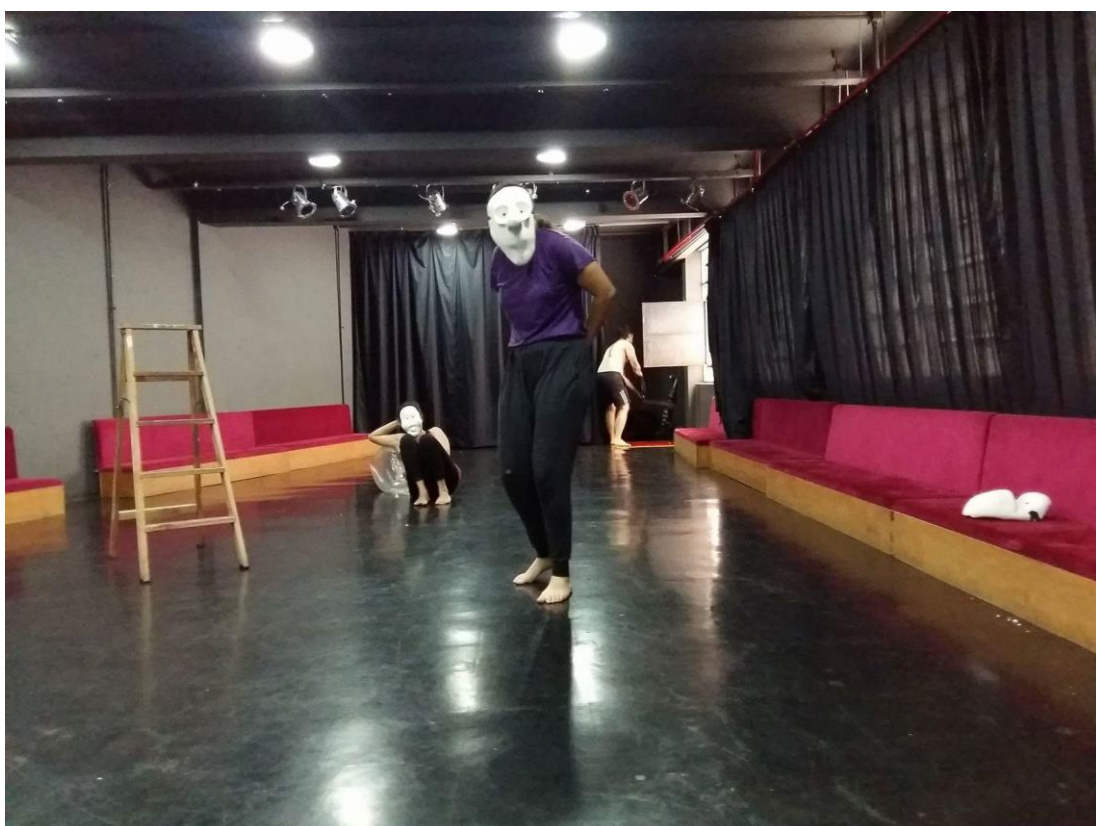
Figura 13. Improvisação com máscara expressiva.