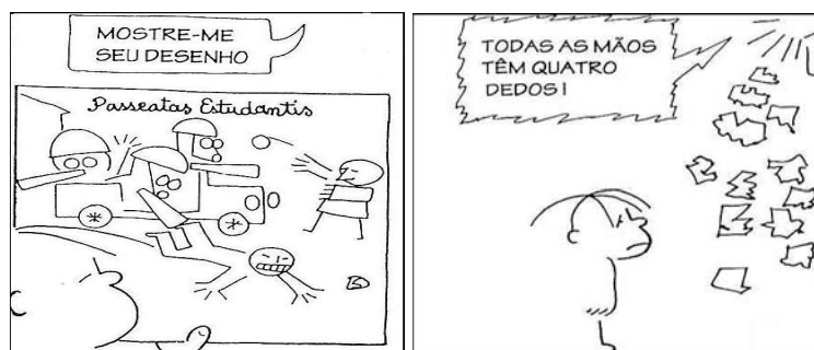
Figura 3 – A criatividade

A figura ilustra uma cena em que a criatividade infantil é, provavelmente, tolhida, desrespeitada, humilhada no sentido ético, moral, entre outras indelicadezas manifestadas por um educador escolar. Esse, provavelmente, sentiu-se melindrado porque a criança não cumpriu regras estabelecidas e decretadas de forma autoritária e extremamente agressiva, o professor rasga o trabalho da criança. Essa figura apresenta, ainda, um rosto de criança permeado de tristeza e decepções, entre outros dissabores a-sociais.