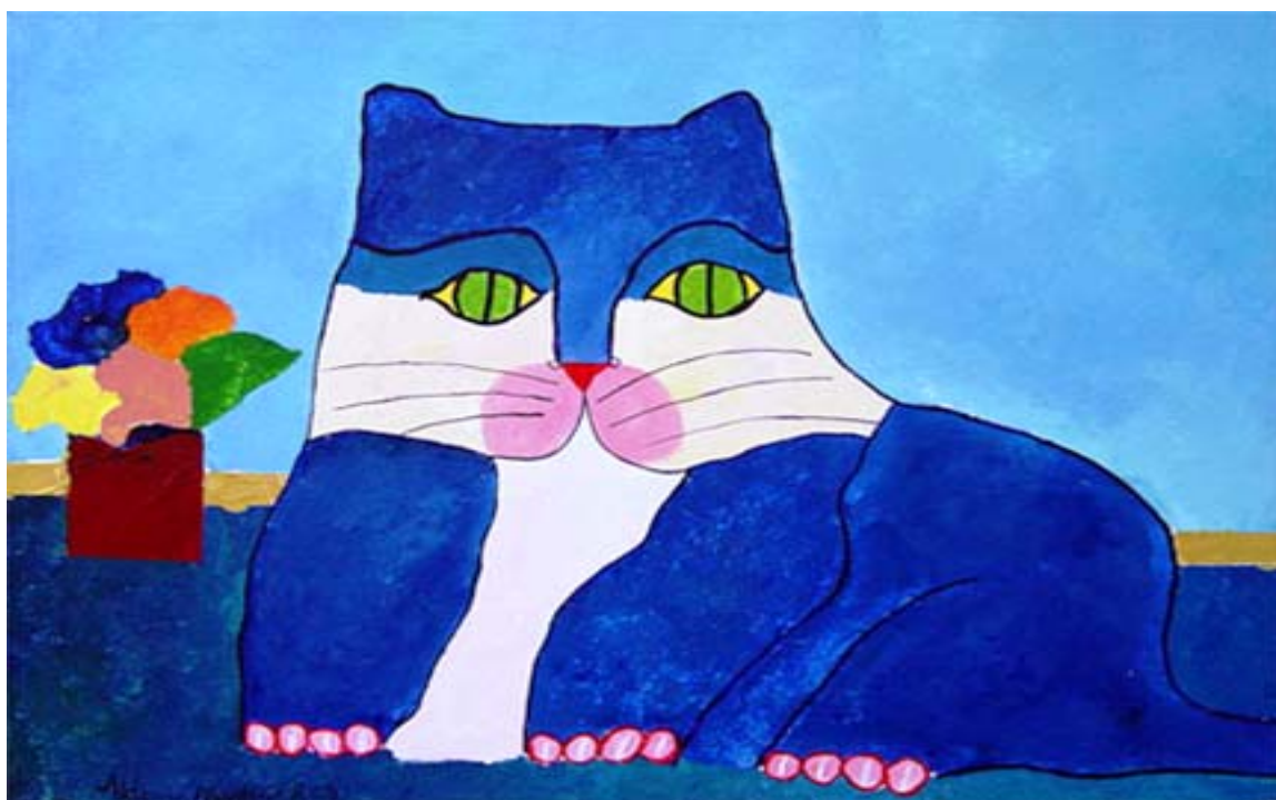
Figura 11 – Gato Azul com Vaso de Flores (2003)

Nesse momento entregou às crianças, ainda dispostas nos mesmos grupos, uma fotocópia do contorno do Gato Azul, conforme pode ser visto na Figura 12, retratado pelo pintor Aldemir Martins (2003). Pediu, então, que as crianças novamente observassem o gato presente na referida obra e perguntou-lhes: “Existe gato azul?” “É um gato ou a representação de um gato?”. Algumas crianças responderam e outras, por estarem envolvidas em conversas e brincadeiras, ignoraram os questionamentos. Com base nas respostas obtidas, a professora pediu-lhes que pintassem a folha contendo a reprodução do contorno do gato, usando de suas livres escolhas.