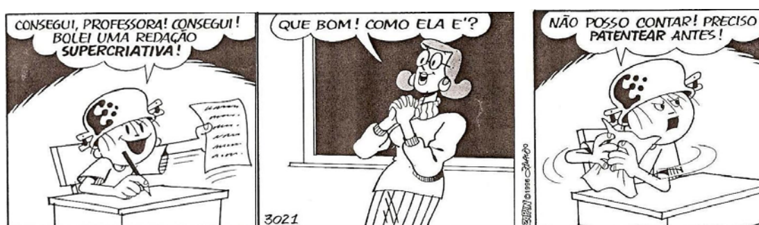
Figura 2 – Menino Maluquinho e a criatividade

O processo denominado de criatividade pode representar, ainda, o próprio viver e o criar humano, razão porque precisa ser compreendido pelo professor como uma característica inerente à sua própria existência. E novamente quem ilustra a percepção da importância da criatividade é o Menino Maluquinho (PINTO, 1994, p. 52). Na Figura 2, o personagem apresenta um elemento importante, ou seja, a criatividade evidenciada ao produzir uma redação.