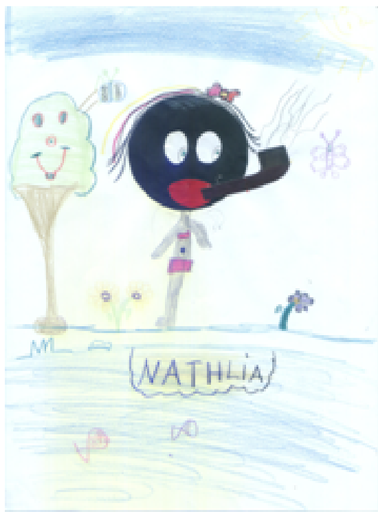
Figura 10 – Sacia com uma nova roupa

A análise dessa aula possibilitou-nos considerar que os processos sócio-históricos interferem na formação de novos conceitos diários, científicos e esses relacionam um com o outro coexistem e formam uma rede de relações dialogais, entre outras formas de comunicação. Acreditamos, que dessa teia de relações socioculturais, a criança pode extrair o conjunto de valores éticos, morais, políticos de cidadania, e outros, que são transmitidos, no sentido não linear por seu grupo social.