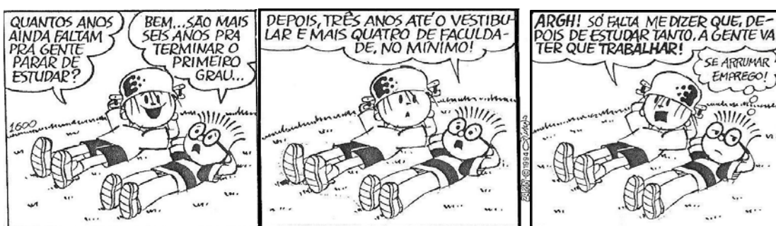
Figura 1 – Menino Maluquinho

Quem percebe essa separação da criança e seu contexto é Pinto (1994), aqui representado pela voz do Menino Maluquinho, personagem da literatura infantil e criado pelo cartunista. Na figura abaixo, o personagem percebe a escola como um espaço criado apenas para estudar penosamente, e assim, podemos observar o sentido de escola para a turminha de crianças criada e figurada por Pinto (1994, p.45).