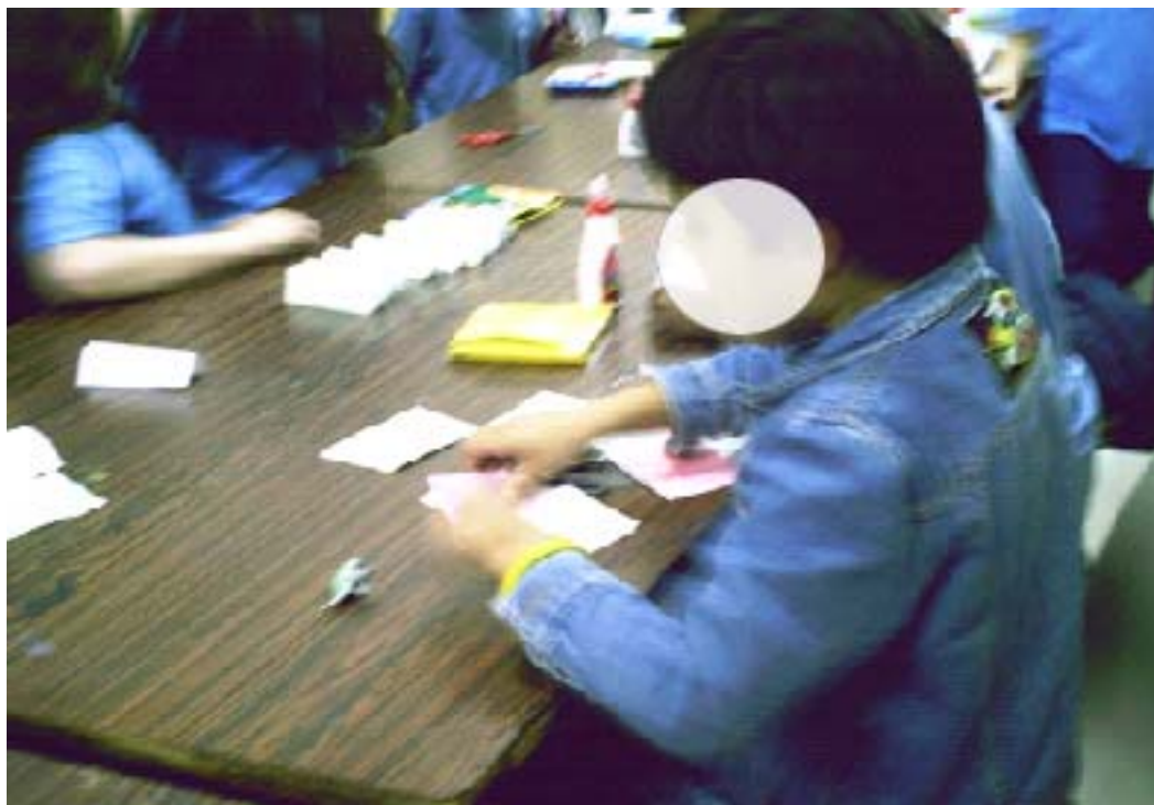
Figura 5 – Crianças criam formas artísticas

A professora continuou com a proposta de trabalho, instigando as crianças para observarem as novas formas que surgiam após cada dobra envolvendo os pequenos retângulos coloridos. Algumas crianças observavam e outras diziam: “ Tenho a impressão de dar vida aos pequenos telhados coloridos ”. Realmente os pequenos retângulos eram similares ao telhado de uma casa.