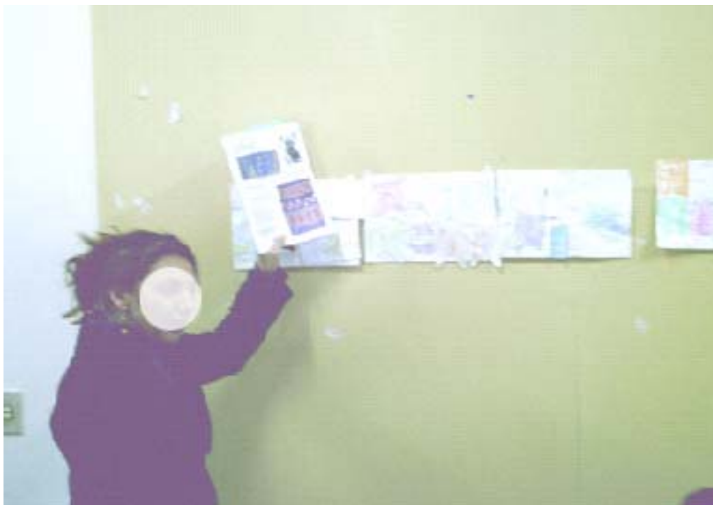
Figura 8 – Gestos e possíveis relações entre fazeres artísticos

Desse modo, crianças mediadas pelas explicações da professora, puderam analisar, explorar visualmente a obra do referido pintor, observando elementos como: estilo, forma, cores, técnica que o artista em questão utilizou para compor o universo imaginário e figurativo criado por ele. Essa proposta é importante e válida porque a criança “[...] também brinca com as linhas, formas e cores da linguagem visual, em produções sonhadas também por artistas que nelas buscaram a liberdade e a ousadia. Ousadia de quem nem sabe que ousa tanto” (MARTINS; PICOSQUE; GUERRA, 1998, p.136).