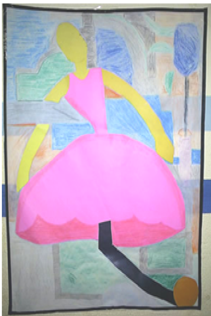
Figura 12 – “A Boneca” de Tarsila do Amaral

Mas, nesse momento explicativo instalou-se um certo tumulto, a professora solicitou novamente atenção à obra, mas a turma é numerosa e a reprodução da tela era de tamanho pequeno, então ela convidou as crianças a virem até o quadro de giz olharem ou sentirem o que a obra poderia lhes transmitir ou comunicar.