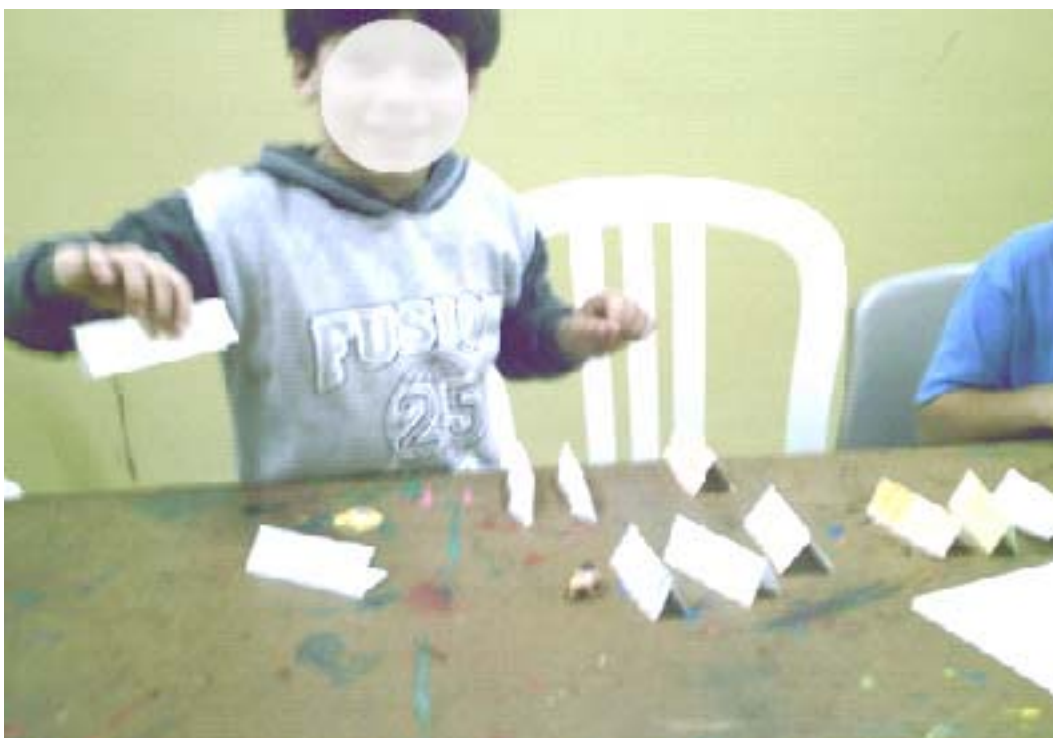
Figura 4 – Cachorrinho dorminhoco criado pela imaginação infantil

Essas manifestações ludo-artísticas infantis, aliadas ao trabalho da professora, possibilitou-nos perceber que ali estava presente também a alegria, a ironia, a imaginação, brincadeira simbólica e o trabalho artístico propriamente dito, que podem ser (re)vistos no contexto das Figuras 4, 5 e 6.