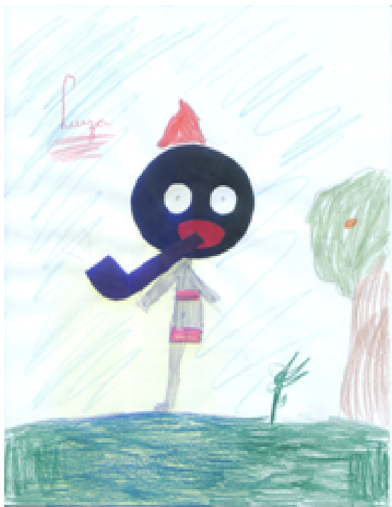
Figura 9 – Sacia, um neologismo criado pelas crianças

Em outras palavras, essas crianças apropriaram-se “[...] das aquisições do desenvolvimento histórico da humanidade, em particular do pensamento e dos conhecimentos humanos” (LEONTIEV, 1964, p.197). No trabalho, nota-se que as crianças ressignificaram o personagem tema da aula e trouxeram novos elementos do seu cotidiano como: lacinho de fita na cabeça, cabelo comprido, saia e blusinha, enriquecendo, modernizando a personagem Sacia, enfim, criando uma nova roupa para a lenda, a qual está presente no contexto da figura 10.